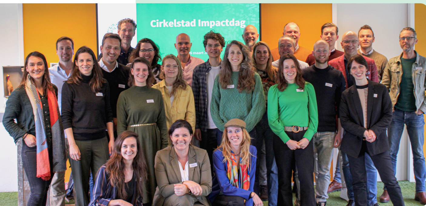
Kernteam en spinners Cirkelstad

M et ons nieuwe collegeprogramma 2024-2026 'Bouwen binnen Planetaire Grenzen voor iedereen' zoekt Cirkelstad de verbreding op. Verbreding van de aandacht voor circulair bouwen binnen onze partner- en vriendenorganisaties, en bij andere organisaties die nog de belangrijke stap naar integraal circulair denken moeten maken. En verbreding naar andere thema's die van belang zijn voor een toekomstbestendige leefomgeving, zoals klimaatadaptiviteit, biodiversiteit en energie. Het afgelopen jaar heeft onze planeet maar weer eens duidelijk gemaakt dat we móéten bouwen binnen planetaire grenzen. De sociale component pakken we hierbij ook op. We willen een samenleving zonder afval, maar zeker ook zonder uitval.